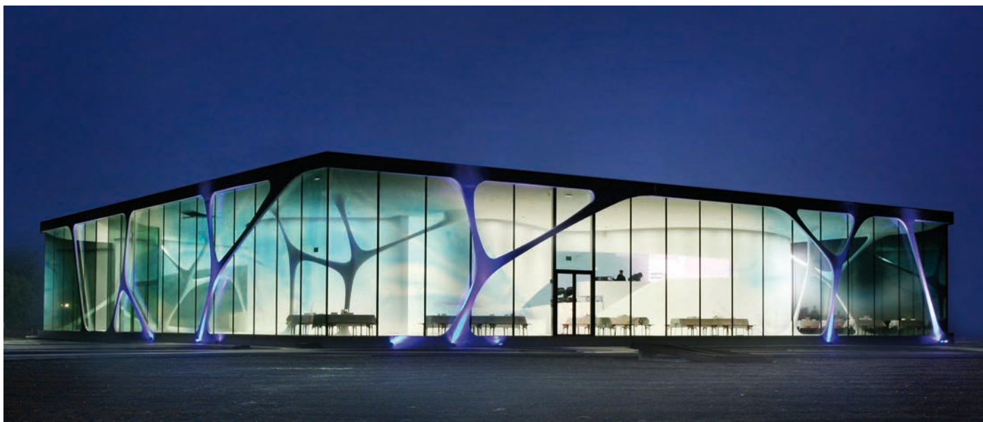
Metazeichen von Leonardo: glasscube bei Nacht.

mehr um gemeinsame Orientierung. Der Blick fürs Ganze geht verloren. Viele Projekte und Prozesse werden immer kleinteiliger. Niemand überblickt mehr den Gesamtzusammenhang. Die Code-Methode bietet Werkzeuge und Wissen für eine andere Orientierung in unserer VUCA 1 -Welt.